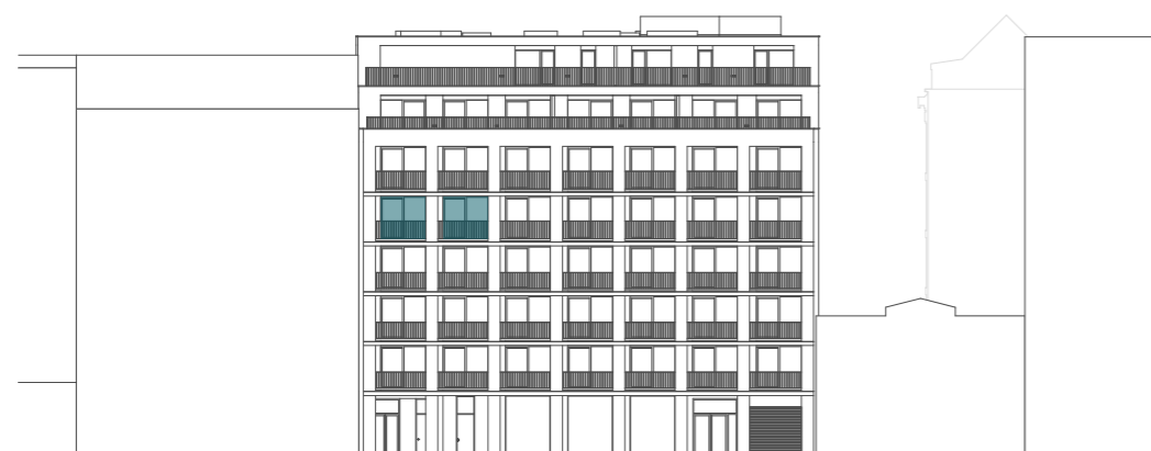
pohled na severní fasádu