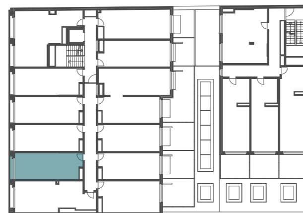
umístění bytu v 2.NP