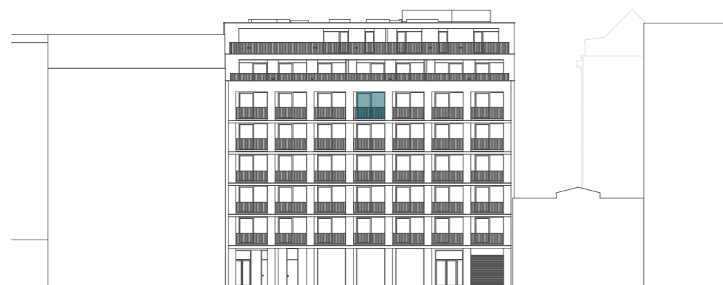
pohled na severní fasádu