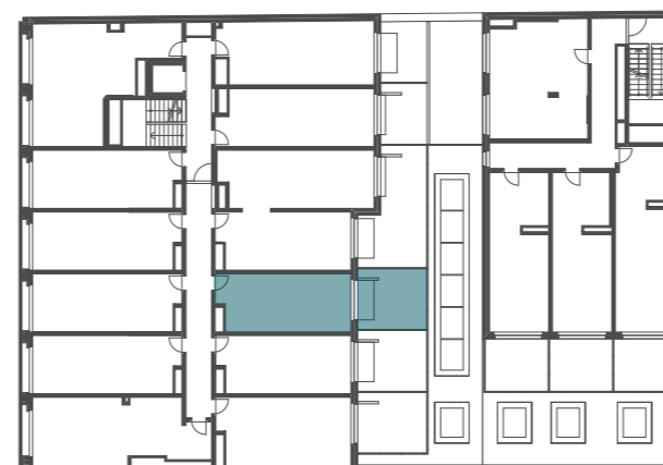
umístění bytu v 2.NP