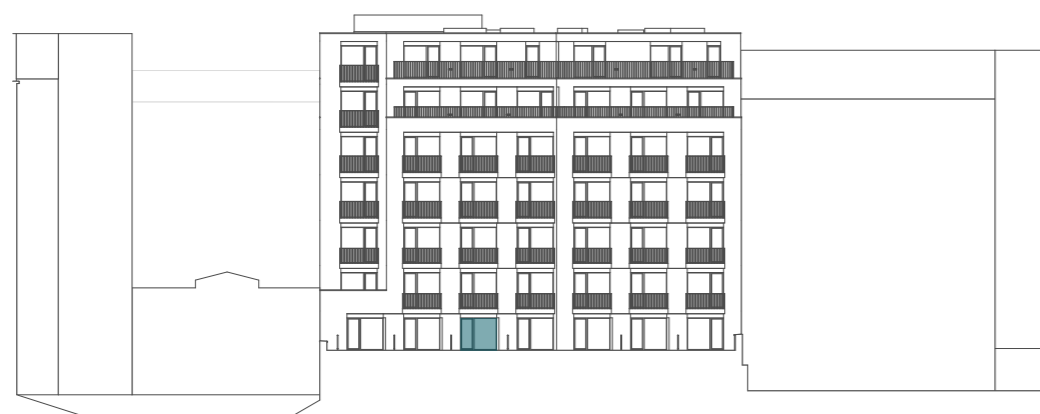
pohled na jižní fasádu