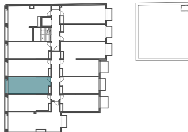
umístění bytu v 4.NP