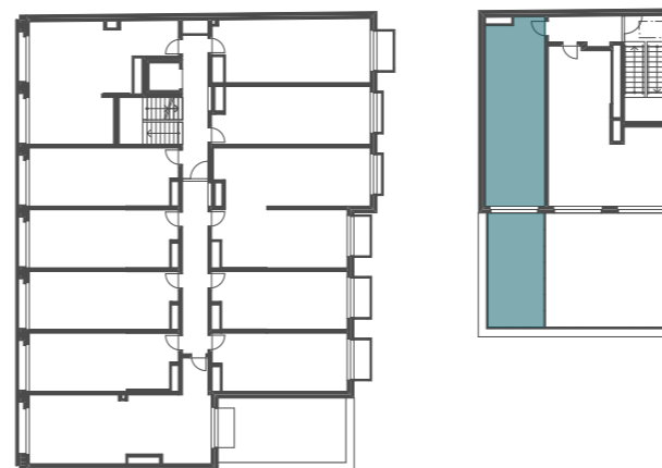
umístění bytu v 3.NP

Upozornění: Podlahová plocha bytu je vypočtena dle nařízení vlády č. 366/2013 Sb., v platném znění. Plochy jednotlivých místností jsou pouze orientační. Vyobrazená zařízení v plánech (nábytek, kuch.linka, el.spotřebiče, atd.) nejsou součástí dodávky bytu. Rozsah dodávky je specifikován ve standardech. Investor si vyhrazuje právo na drobné úpravy.