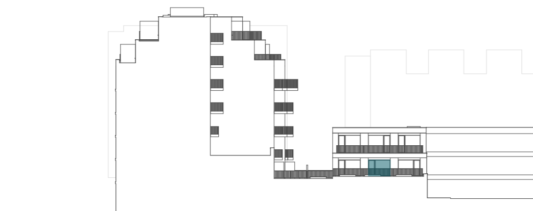
pohled na západní fasádu