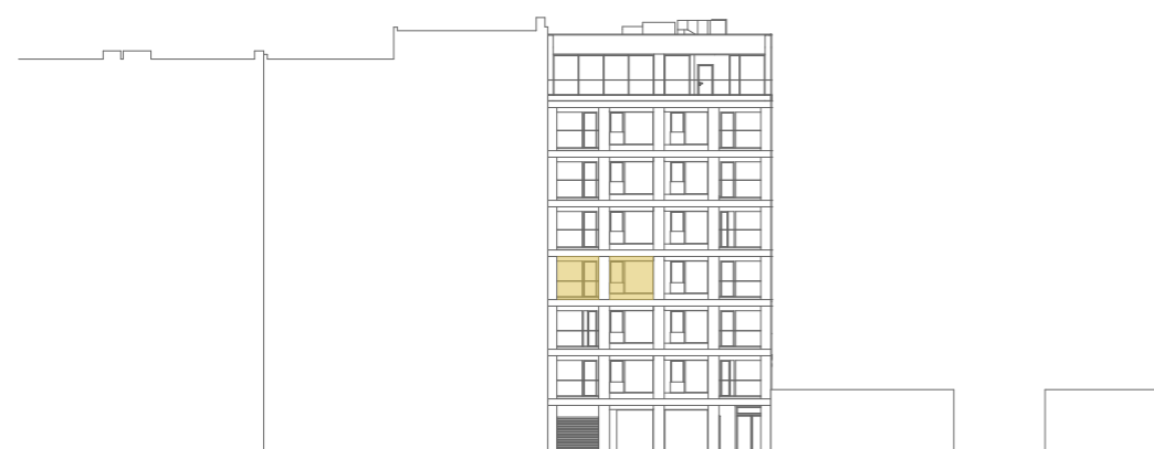
pohled na jižní fasádu