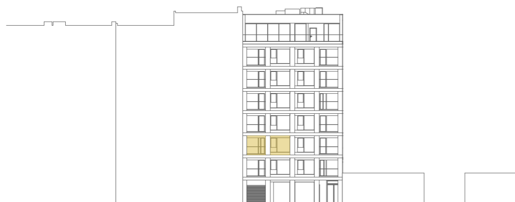
pohled na jižní fasádu