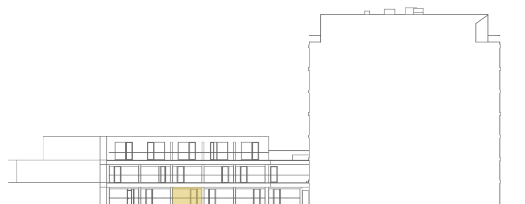
pohled na západní fasádu