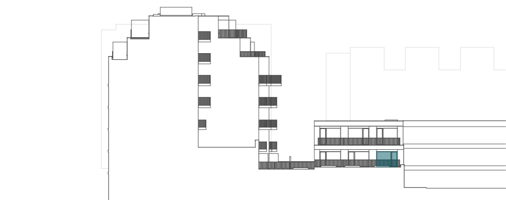
pohled na západní fasádu