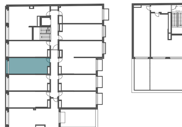
umístění bytu v 3.NP