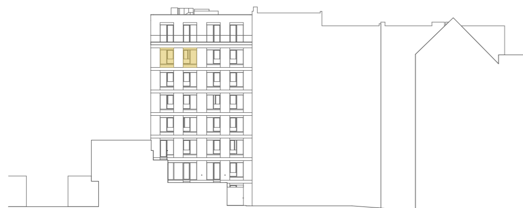
pohled na severní fasádu